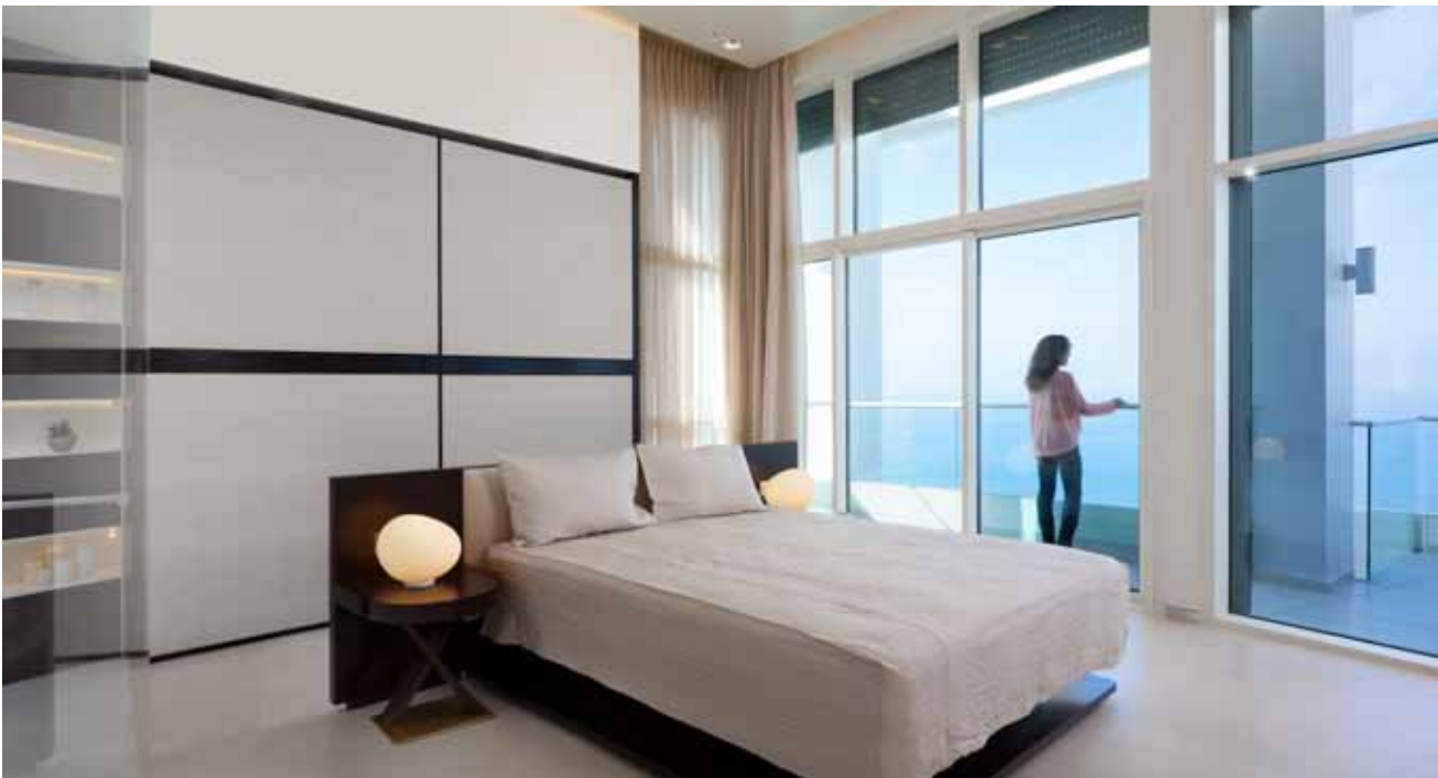
יציאה למרפסת גם מחדר השינה. האלומיניום בוטרינות נצבע בגון לבן והארון שמאחורי המיטה משתלב בתוך גומחה בקיר. חזיתות בריפוד בד בדיגום קרוקודיל, זהה לזה המשמש בגב המיטה, מייצרות מראה של חיפוי קיר.